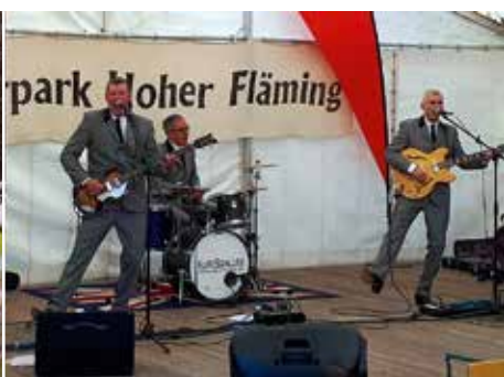
Landfrauen in Aktion Kurzschluss – Feine Beatmusik