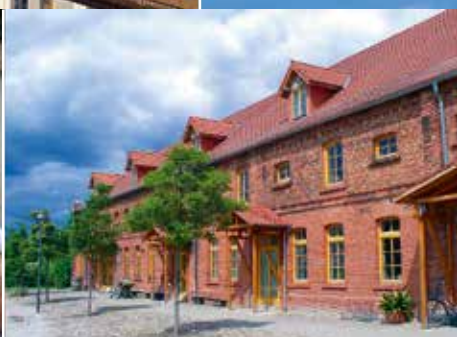
Kartoffelfrucht Handwerkerhof Görzke