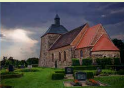
Burg Eisenhardt Kirche Bergholz