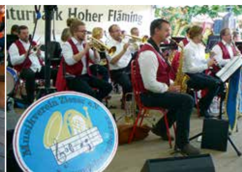
Spinnen Musikverein Ziesar