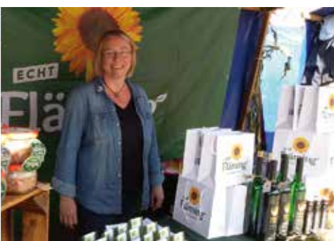
Rosmarin-Kartoffeln Echt Fläming Produkte