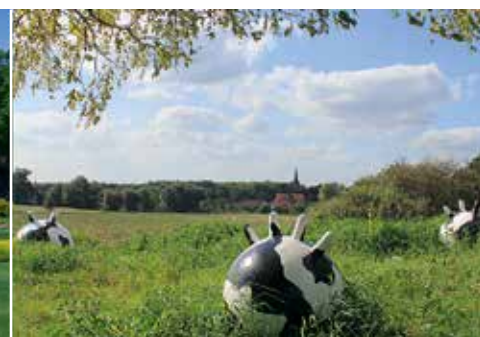
Wiesenburger Schlosspark Kunstwanderweg