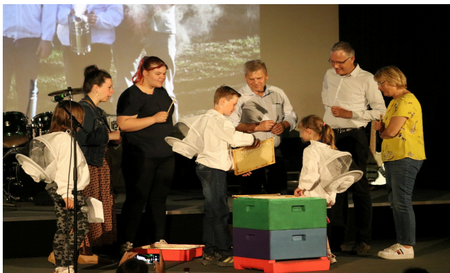
Jugendumweltpreis 2022 - IMKERPROJEKT

„WAS WIR HEUTE TUN, ENTSCHEIDET DARÜBER, WIE DIE WELT MORGEN AUSSIEHT“