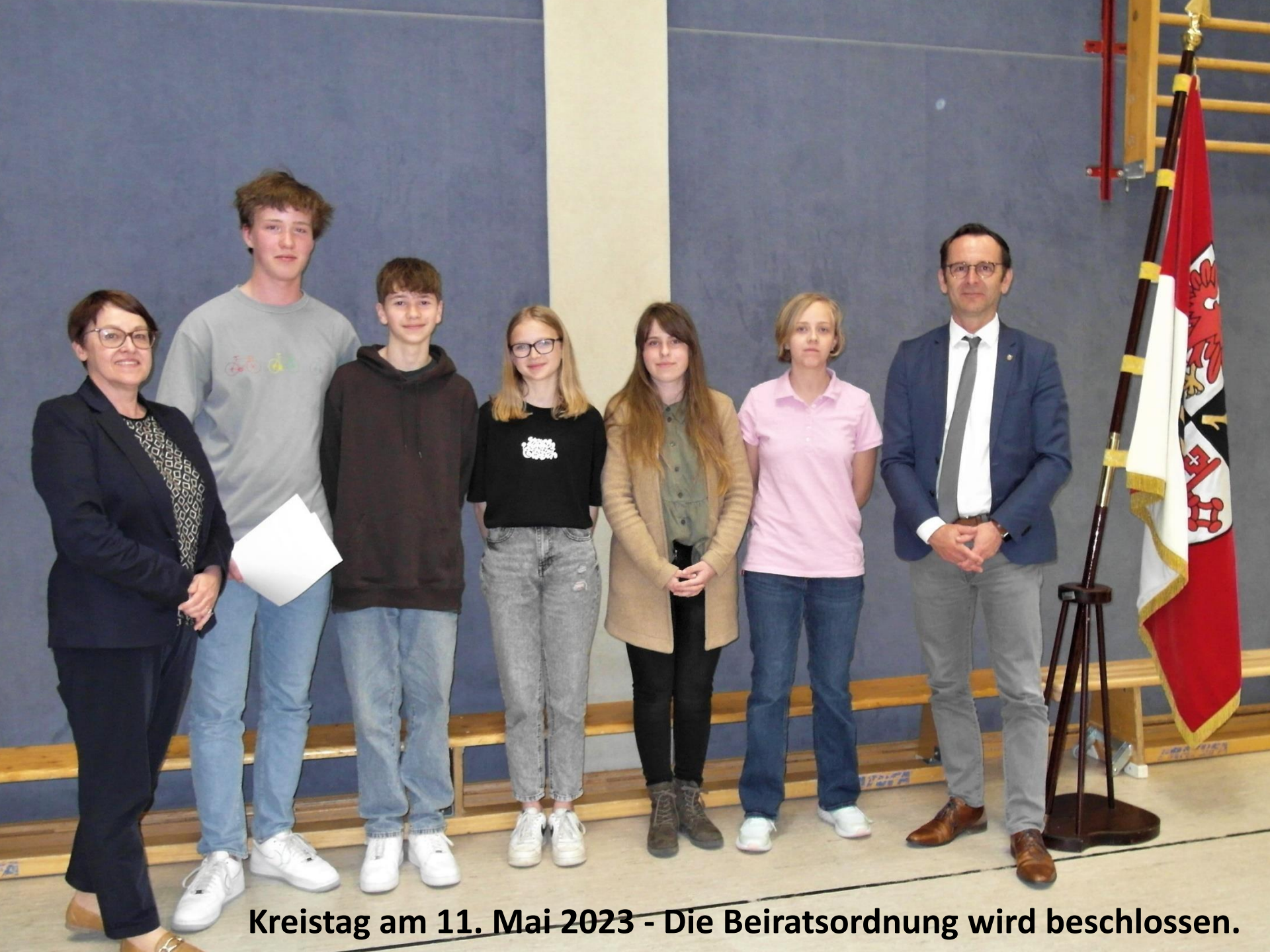
Kreistag am 11. Mai 2023 - Die Beiratsordnung wird beschlossen.